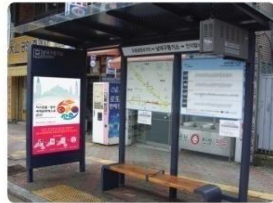
| 근색비조명 |