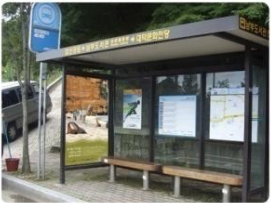
| 일반비조명 |