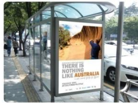
| 택시조명 |