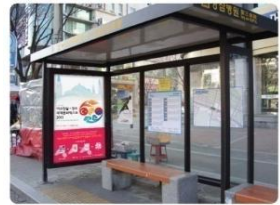
| 일반조명 |