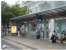
| 대형조명 |