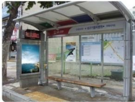
| 은색비조명 |